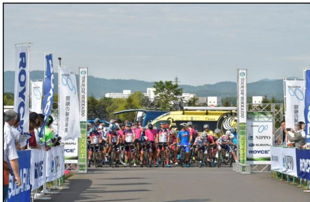
9/6 第1ステージ 旭川市 総合防災センター スタートを待つ選手たち

9月6日から9月8日までの3日間、北海道の道北及び道東地域4市16町において、UCI(国際自転車競技連合)公認の国際大会として、海外・国内から20チーム・選手99名が参加し、一般公道を使用した町から町へと巡る本格的ロードレースを実施しました。北海道の屋根と称される大雪山系及び十勝岳連峰を舞台に、総走行距離541kmの過酷な山岳レースが展開されました。