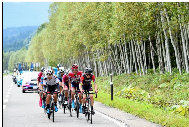
9/7 第2ステージ 上士幌町 82Km付近 白樺並木の前を走るメイン集団