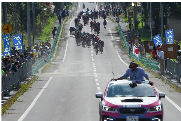
9/8 第3ステージ 当麻町 残り200mフィニッシュ前のスプリント