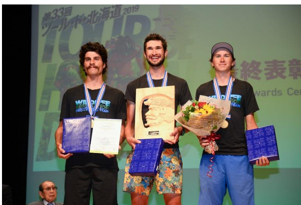
U26で総合時間賞を獲得した ワイルドライフジェネレーションプロサイクリング P/B MAXXIS