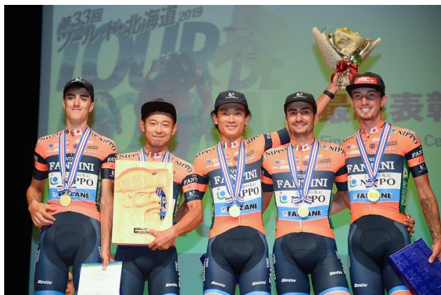
チーム総合時間賞は3日間首位を守った NIPPO-ヴィーニ ファンティーニ-ファイザネ